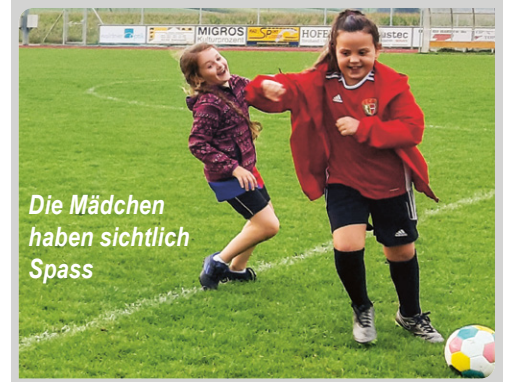
Die Mädchen haben sichtlich Spass