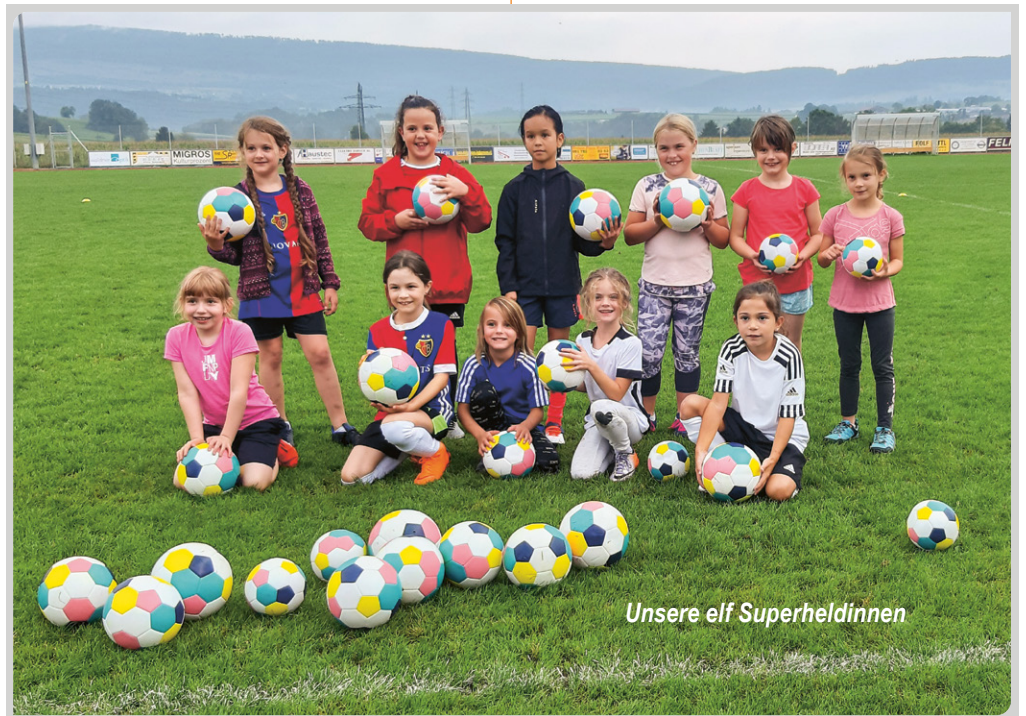
Unsere elf Superheldinnen